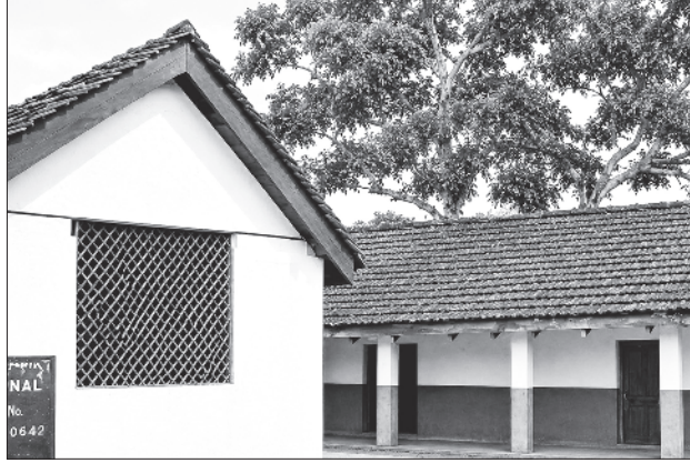
1904-இல் தொடங்கப்பட்ட தாயம்மாள் பெண்கள் பள்ளி