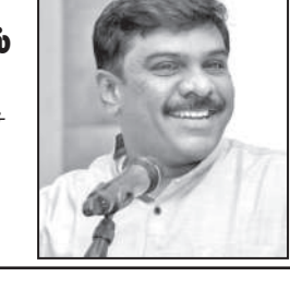
பேற்கச் செய்ததோடு அவர்களை சென்னைக்கு வரவழைத்து பாராட்டு விழாவும் நடத்தியது தி.மு.க. அரசு.

தி.மு.க. ஆட்சி ஏதோ தலித்துகளுக்கு எதிரான ஆட்சி என்பது போன்ற போலித்தோற்றத்தை உள்நோக்கத் தோடு ஏற்படுத்திய போலி போராளிகள் யாரும் இதை இந்த நிமிடம் வரைக் கண்டிக்கவில்லை. இப்போதும் பாதிக்கப்பட்டோருக்கு களத்திற்கு முதலில் சென்று அவர்களோடு நிற்க தி.மு.க.தான். இந்த நேரத்தில்