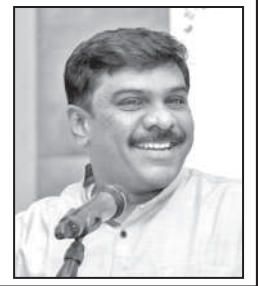
பேற்கச் செய்ததோடு அவர்களை சென்னைக்கு வரவழைத்து பாராட்டு விழாவும் நடத்தியது தி.மு.க. அரசு.

இந்த துயர சக்தி ஆட்சிக்கு வந்த 15 நாட்களில் 25 கொலை, 4 இரட்டைக் கொலை, 19 பாலியல் குற்றங்கள் என தமிழ்நாட்டு குற்ற யுரியாக மாறிப் போயுள்ளதைக் கண்டு குமுறுகின்றனர் தமிழக மக்கள். மறு புறம் தொடரும் மின்தடையால் மக்கள் சாலைகளில் போராடத் தொடங்கியுள்ளனர். இவற்றை எல்லாம் மடை மாற்று வதற்கு, வேளாண் கடன் தள்ளுபடி என்று வந்த அறிவிப்பும் மக்களை ஏமாற்றும் மலிவான அரசியல் என்பதைக் கண்டறிந்து விவசாயிகள் போராட்டத்தில் இறங்கியுள்ளனர். ஆட்சிக்கு வந்த உடனடியே இதையெல்லாம் சரி செய்ய முடியுமா, கொஞ்சம் நேரம் கொடுக்க வேண்டும் என்று துயர சக்திக்காக விசிலடிக்கும் போலி நடுநிலையாளர்கள் கொந்தளிப்புகின்றனர். தி.மு.க. தலைவரும் அரசியல் மாண்புமிகு 6 மாத காலம் மிக முக்கியமான பிரச்சினைகள் தவிர மற்ற வகைகளில் இந்த அரசுக்கு எதிராக கடும் விமர்சனங்களை எதும் வைக்க மாட்டோம் என்று சொல்லிவிட்டார்.