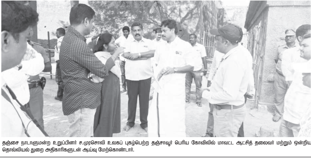
தஞ்சை நாடாளுமன்ற உறுப்பினர் ச.முரசொலி உலகப் புகழ்பெற்ற தஞ்சை பெரிய கோவிலில் மாவட்ட ஆட்சித் தலைவர் மற்றும் ஒன்றிய தொல்வியல் துறை அதிகாரிகளுடன் ஆய்வு மேற்கொண்டார்.