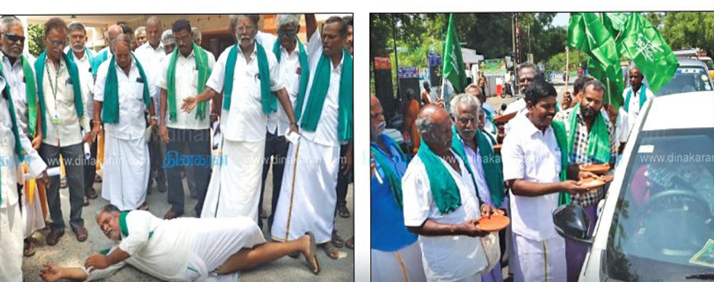
பயிர்க்கடன்களை முழுமையாக தள்ளுபடி செய்ய வலியுறுத்தி தமிழ்நாட்டின் பல்வேறு பகுதிகளில் மாவட்ட ஆட்சியர்கள் அலுவலகத்தில் விவசாயிகள் போராட்டம்