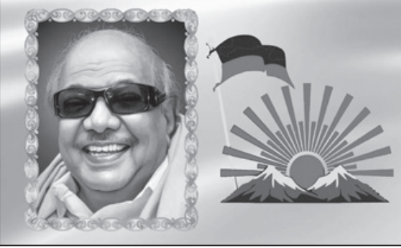
கொண்டோன் புதிய வரலாற்றை உருவாக்க வேண்டும்.

தமிழ்நாட்டை எண்ணிப் பார்க்கும் மார்க்ஸ் மேற்கோள் சிறப்பாகப் புரியும். பார்க்ப்போம். வர்ண தர்மம், சனாதனம், ஆணாதிக்கம், ஐதீயம் எல்லாமே தூக்கனவர்களாக வாழ்பவர்களின் ஆன்மாவைப் பிடித்துள்ளன. அந்த சூழ்நிலையை எதிர்கொண்டதான் சமூக நீதியும், சமத்துவமும் நிலவும் புதிய மக்களாட்சி சமூகத்தை உருவாக்க வேண்டும். பல நூற்றாண்டுகளாக, ஓராமிரம், ஈராமிரம் ஆண்டுகளாக மொழியில், சொல்லாடலில், கதையாடலில் உருவாகிய எண்ணற்ற மூட நம்பிக்கைகள், கற்பிதங்கள், ஏற்றத் தாழ்வுகள், சுரண்டல் அமைப்புகள் எல்லாவற்றையும் எதிர்