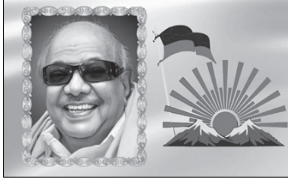
கொண்டுதான் புதிய வரலாற்றை உருவாக்க வேண்டும்.

சுதந்திர இந்தியாவின் அரசியல் வரலாற்றில் இவ்வாறு அரை நூற்றாண்டுக்காலம் ஒரு கட்சியை வழி நடத்தியவர், ஒரு மாநிலத்தின் வரலாற்றை நிர்ணயித்தவர் என்று வேறு எவரையும் சொல்ல இயலாது. உலக அளவில் கூட ஃபிடல் காஸ்ட்ரோ என்ற ஒருவர் பெயர்