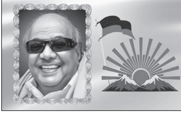
கொண்டுதான் புதிய வரலாற்றை உருவாக்க வேண்டும்.

சுதந்திர இந்தியாவின் அரசியல் வரலாற்றில் இவ்வாறு அரை நூற்றாண்டுக்காலம் ஒரு கட்சியை வழி நடத்தியவர், ஒரு மாநிலத்தின் வரலாற்றை நிர்ணயித்தவர் என்று வேறு எவரையும் சொல்ல இயலாது. உலக அளவில் கூட ஃபிடல் காஸ்ட்ரோ என்ற ஒருவர் பெயர்