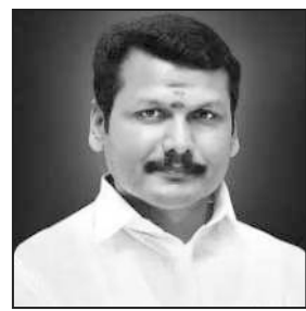
மீழறிஞர் கலைஞர் அவர்கள்.

ஏழை, எளியவர்கள், விவசாயிகள், தொழிலாளர்கள், மகளிர், நெசவாளர்கள், வணிகர்கள், அரசு ஊழியர்கள், மாணவர்கள், மாணவிகள், இளைஞர்கள், மாற்றுத்திறனாளிகள், திருநங்கைகள், சிறுபான்மையினர் என அனைத்து தரப்பினரின் நல்வாழ்வுக்காக “கண்துஞ்சா மல் தொடர்ந்து உழைத்த தாய் தலைவர்” நமது முத்த