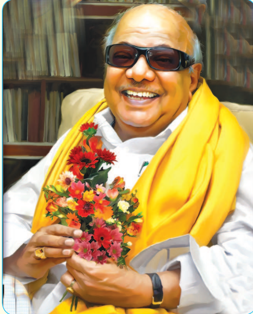
மக்களாட்சிக்கு விரோதமான சக்திகள்

சட்டமன்றத் துறை, நீதித் துறை, நிர்வாகத் துறை மற்றும் பத்திரிகைகள் துறை என நான்கு தூண்களே மக்களாட்சி எனும் மணி மண்டபத்தைத் தாங்கிக் கொண்டிருக்கின்றன. அந்தத் தூண்கள் எத்தகைய தூய்மையான நோக்கத்தை தாங்கிப் பிடிப்பதற்காக உருவாக்கப்பட்டனவோ அந்த நோக்கங்கள் இந்த நூற்றாண்டில் மிகப் பெரும் சோதனைக்குள்ளாகி சவால்களை எதிர்நோக்கி உள்ளன.