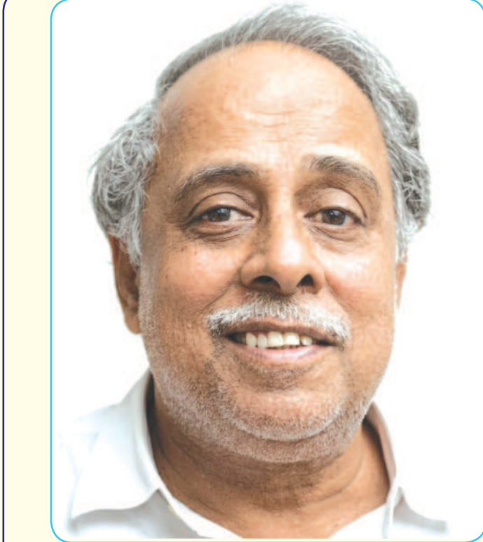
தன்னை வெல்வான் - துரணியை வெல்வான்

கொடுமைகள் இழைக்கப்படும்போது, அநீதி தலைவிரித்தாடும் போது, அக்கிரமம் தம் அகன்ற வாயினைத் திறந்து அகோரக் கூச்சலிடும் போதெல்லாம் இறுதியில் நன்மைக்கே என்ற தத்துவத்தைத் துணைக்கழைத்துச் சமாதானம் தேடிக்கொள்ள முடியவில்லை. காரணம், நாம் ஒரு அரசியல் கட்சியின் உறுப்பினர்கள் என்ற முறையிலே மட்டும் இருந்து வருபவர்கள் அல்லர். பாசத்தால் பிணைக்கப்பட்ட ஒரு குடும்பமாகி விட்டிருக்கிறோம். அதனால் நம்மில் சிலருக்கு இழைக்கப்படும் கொடுமை, நம் எல்லோருடைய உள்ளத்தையும் வேதனையில் ஆழ்த்திவிடுகிறது.