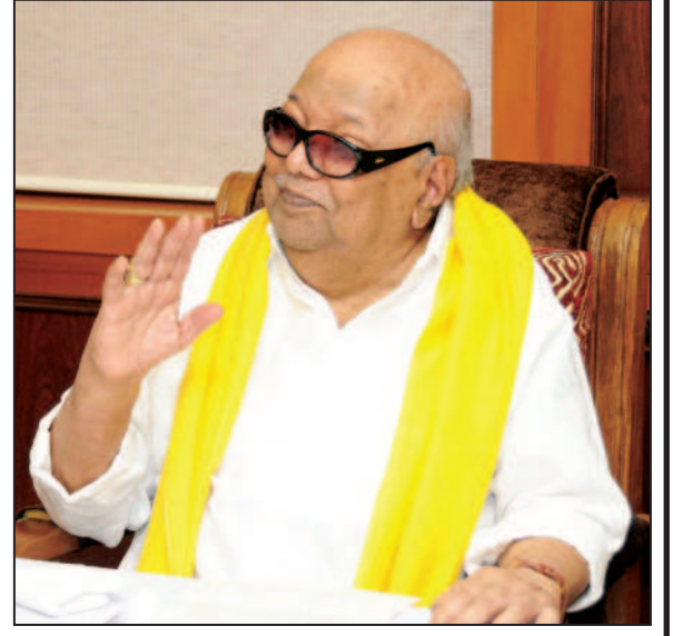
ஏந்தி நடப்போம்! ஆதித்தமிழர் நெஞ்சங்களில் என்றும் வாழும் முத்தமிழறிஞருக்கு வீரவணக்கமும், பிறந்தநாள் வாழ்த்துகளும்!

பெரியாரியக் களத்தில் நின்று, கலைஞர் ஏற்றி வைத்த சமூகநீதிச் சுடரை இன்னும் பிரகாசமாக