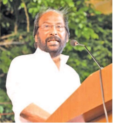
எதிர்க்கால என்றால், மன்னர் மானியத்தை ஒழித்தார். வங்கிகளை தேசிய உடைமையாக்கினார். முற்போக்குத் திட்டங்களை செயல்படுத்துகிறார் என்கிற காரணத்தினால்தான், கூட்டணி அமைக்கிறோம்.

கலைஞர் முதலமைச்சராக இருந்தபோது வீரனாக இருந்த காரணத்தினால்தான், போராணியாக இருந்த காரணத்தினால்தான், அவசரநிலையை எதிர்த்தார். நன்றாக நினைவிட கொள்ளுங்கள். 1971ஆம் ஆண்டு முதன் முதலாக தீ. மு. கழகம் காங்கிரஸ் கட்சியோடு கூட்டணி வைக்கிறது. இந்திராகாந்தி அம்மையாரோடு, அது