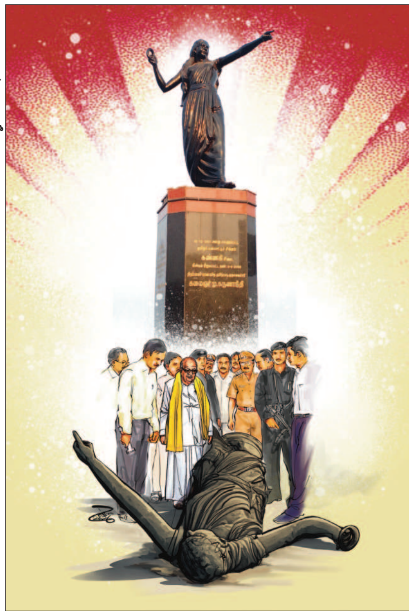
ஒவியம்: ரவி பேலட்

அலட்சியப்படுத்த முடியுமா? சிலைதானே என்று கேவலப்படுத்தி விடுவதா? அதனுடைய பொருள் என்ன? அதிலே அடங்கியிருக்கின்ற அர்த்தம் என்ன? அதிலே அடங்கிக் கிடக்கின்ற பண்பாடு எது? அதிலே பூத்துக்குலுங்குகின்ற கலாசாரம், அதனுடைய பழமை, அதனுடைய பெருமை இவை எல்லாம் என்ன? இவற்றை எண்ணிப் பார்க்க வேண்டாமா? அது காரத்திலே அமர்ந்து விட்ட காரணத்தால்; கடந்த ஆட்சிக்காலத்தைப் போல ஆணவக்குரல் அல்ல. அடக்கமான குரல்தான், வேண்டுகோள் குரல்தான், ஏற்கெனவே தமிழன் சீரழிந்து கிடக்கின்றான். இந்த நிலையிலேதான் நாம் இழந்த ஒரு சுதந்திரத்தை, இழந்த ஒரு பெருமையை இன்றைக்கு மீட்டுக் கொண்டு வந்து இந்தக் கடற்கரையிலே, காமராஜர் சாலையிலே நிலைநாட்டியிருக்கிறோம்.