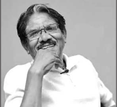
என்ற பெருமைக்குரியவரும் ஆவார்.

சென்னை, ஜூன் 11- தமிழ் சினிமாவில் இயக்குனர் இமயம் என அழைக்கப்பட்ட இயக்குனர் பாரதிராஜா அவர்கள், (வயது 84), உடல்நலக்குறைவால் நேற்று (10.6.2026 - புதன்கிழமை) காலை கியூர்கு எய்தினார் என்பதை அறிவிக்க வாரிசு வழங்கியுள்ளார்.