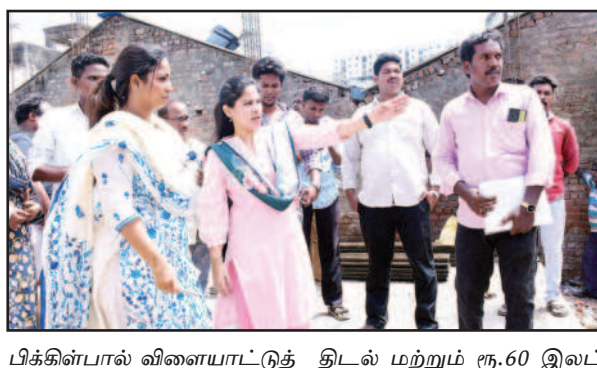
பிக்கின்பால் விளையாட்டுத் திடல் மற்றும் ரூ.60 இலட்சம் மதிப்பீட்டில் கட்டப்பட்டு வரும் மகளிர் உடற்பயிற்சித் திடல் உள்ளிட்ட கட்டுமானப் பணிகளைப் பார்வையிட்டு, பணிகள் அனைத்தும் விரைந்து முடித்து பொதுமக்கள் பயன்பாட்டிற்குக் கொண்டு வர அலுவலர்களுக்கு அறிவுறுத்தினார்.