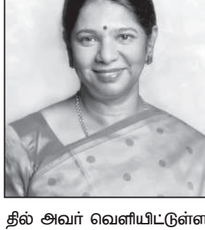
தில் அவர் வெளியிட்டுள்ள பதிவு வருமாறு:-

சென்னை, ஜூன் 11 - தமிழ்நாடு அரசு கேபினஸ் ஒளிபரப்பிலிருந்து சில தமிழ் செய்தித் தொலைக்காட்சிகள் நீக்கப்பட்டுள்ளன. அதற்கு கழக துணைப் பொதுச் செயலாளர் கனிமொழி கருணாநிதி எம்.பி. கரும் கண்டனம் தெரிவித்துள்ளார். இது குறித்து வலைதளத்தில் அவர் வெளியிட்டுள்ள பதிவு வருமாறு:-