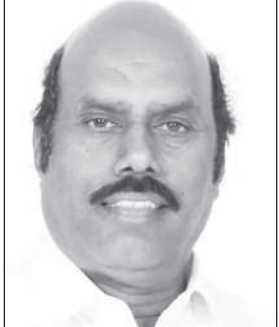
போது... ஆன்மீகமும், திராவிடமும் சேர்ந்த சிறப்பிற்குரிய மண் இந்த மண். திருவண்ணாமலை அண்ணாமலை மலை யார் கோயிலை பா.ஜ.க. ஆட்சியில் தொல்மீயியல் துறை கையகப்படுத்தி மேற்கொண்ட முயற்சியை தடுத்து நிறுத்தியவர் கலைஞர். திருவண்ணாமலைக்கு ஏராளமான பத்தர்கள் வருகின்றனர். அதன் மூலம் இந்த நகரின் பொருளாதாரம் வளர்ந்திருக்கிறது. தி.மு.க. ஆட்சிக்காலத்தில் தான் திருவண்ணாமலை மாவட்டம் வளர்ச்சி பெற்றது. திருவண்ணாமலை புதிய மாவட்டமாக உருவானது.

திருவண்ணாமலை, ஜூன் 11 - இந்த ஆட்சிக்கு பவர் கொடுத்தது தி.மு.க. - பவர் கட செய்தது த.வெ.க. என்று திருவண்ணாமலை மாநகர தி.மு.க. சார்பில் நடைபெற்ற முத்தமிழறிஞர் கலைஞர் அவர்களின் 103வது பிறந்த நாள் விழாவில், 1500 பயனாளிகளுக்கு நலஉதவிகள் வழங்கி உரையாற்றும்போது, கழகக் கொறடையும், முன்னாள் அமைச்சருமான எ.வ.வேலு அவர்கள் குறிப்பிட்டார்.