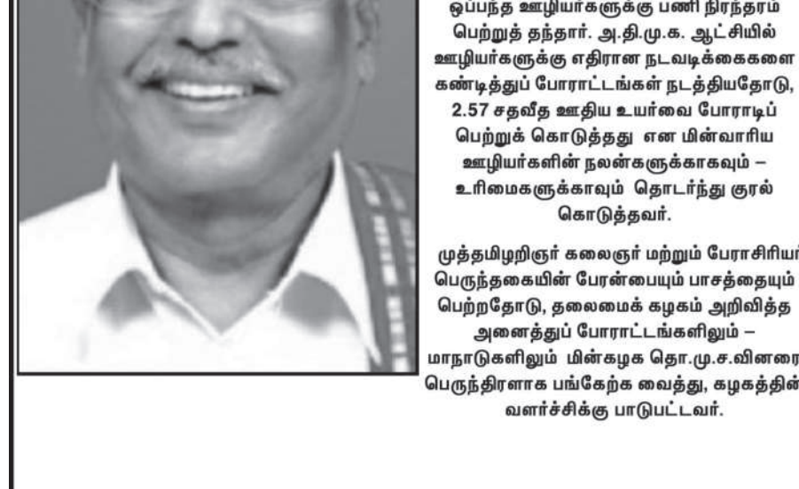
தலைமைக் கழகம் தி.மு.க.