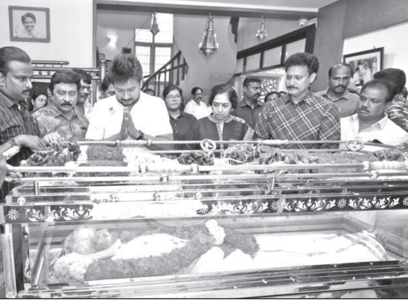
அரசாங்கத்தின் இருந்த சினிமாவை வயல்வெளிக்கும் - கடற்கரைக்கும் - கிராமங்களுக்கும் எடுத்துச் சென்ற வித்தைக்காரர்.

'இயக்குனர் இமயம்' பாரதிராஜா மறைவுக்கு இரங்கல் தெரிவித்து எதிர்க்கட்சித் தலைவர் உதயநிதி ஸ்டாலின் அவர்கள் வெளியிட்டுள்ள சமூக வலைதளப் பதிவில், 'என் இனிய தமிழ் மக்களே' என்ற அவரின் குரல் என்றும் ஒலித்துக் கொண்டே இருக்கும் என்றும்; தமிழ்ச் சினிமாவில் புதுப்பாய்ச்சலை ஏற்படுத்தியவர் என்றும் குறிப்பிட்டுள்ளார்.