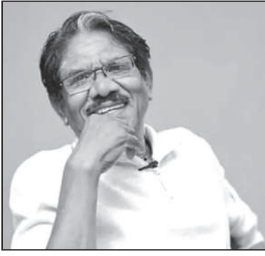
என்ற பெருமைக்குரியவரும் ஆவார்.

தமிழ் சினிமாவில் இயக்குனர் இமயம் என அழைக்கப்பட்ட இயக்குனர் பாரதிராஜா அவர்கள் (வயது 84), உடல்நலக்குறைவால் நேற்று முன்தினம் (10.6.2026-புதன்கிழமை) காலை இயற்கை எய்தினார் என்பதை அறிவிக்க பெரிதும் வருந்துகிறோம்.