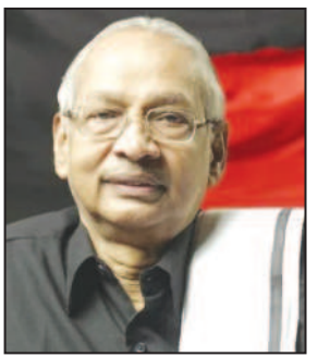
பெற்று, பல லட்சக்கணக்கானோர் விரும்பும் சமூக ஊடகப் பக்கமாக மாறி விட்டது. பாரதிய ஜனதா கட்சிக்கு (பி.ஜே.பி) எதிராக சி.ஜே.பி. என்னும் பெயரில் உருவான இந்தப் பெயர் திடீரென இளைஞர்கள் மத்தியில் பிரபலமாகி, அது ஓர் அமைப்பாக உருவாவதற்கான சூழல் எழும் முன்னே அந்தப் பெயரில் மதுரையில் ஒரு பேரணி எல்லாம் கூட நடைபெற்று முடிந்தது.

சென்னை, ஜூன் 14- "நாம் எதிர்க்கும் பா.ஜ.க.வை, தத்துவார்த்தப் பார்வையில் அல்லாமல் சில நடப்புப் பிரச்சினைகளைக் களக்காக சி.ஜே.பி. எதிர்க்கிறார்கள் என்ற ஒரே காரணத்துக்காக, அந்தக் குழுவை சமயோசிதமாக ஆதரிக்கவா என்று (Political Expediency) என்றையும் ஆதரித்துவிட முடியாது. இளைஞர்களின் எதிர்ப்புணர்வையும், போராட்டங்களையும் நாம் குறைத்து மதிப்பிட வேண்டியதில்லை என்றாலும், அவசரப்பட்டு விழுந்து ஆதரிக்க வேண்டிய யதில்லை. 'கர்ப்பான் பூச்சி ஜனதா' கொஞ்சகாலம் கண்காணிப்பிலேயே இருக்கட்டும்" என்று திராவிடர் கழகத் தலைவர் கி.வீரமணி அவர்கள் அறிக்கை விடுத்துள்ளார்.