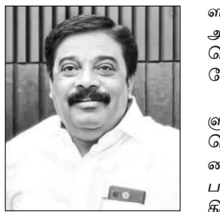
கள்ளக்குறிச்சி மாவட்டத்தில் அடிக்கடி நடக்கும் மின் வெட்டை சரி செய்யுமாறு கேட்டுக் கொண்டார்.