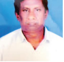
13-6-2026 அன்று மதுரையில் இயற்கை எய்தினார்.