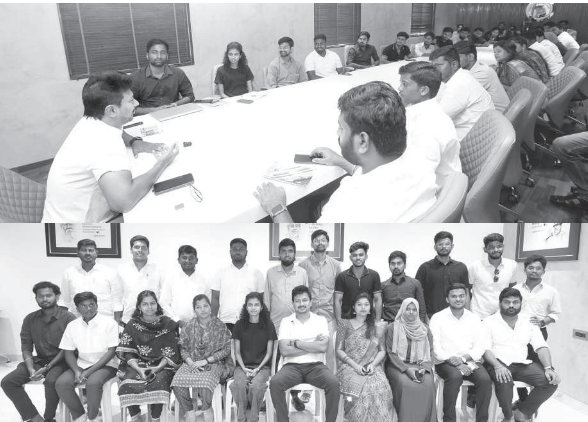
சென்னை - காஞ்சிபுரம் - செங்கல்பட்டு - திருவள்ளூர் மாவட்டங்களைச் சேர்ந்த தி.மு.க.வின் இளம் பேச்சாளர்களுக்காக, நேற்று முன்தினம், சென்னை- அன்பகத்தில் 'சமூக ஊடகப் பயிற்சி அமர்வு' ஒன்றை, கழக இளைஞர் அணிச் செயலாளரும் சட்டமன்ற எதிர்க்கட்சித் தலைவருமான உதயநிதி ஸ்டாலின் அவர்கள் நடத்தினார்கள். அந்த அமர்வில் தற்போதைய அரசியல் க்யூலில், தி.மு.க.வின் பணிகளையும் பொதுச் சேவையையும் எவ்வாறு திறம்பட மேற்கொள்வது என்பது குறித்து விவாதித்தார்கள்.