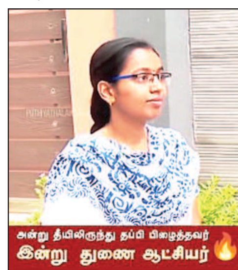
அன்று தமிழிலிருந்து தபி விசுத்தவர் இன்று துணை ஆட்சியர்

சென்னை, ஜூன் 22 - நீங்கள் 'நான் முதல்வன்' திட்டத்தின் பெயரை மாற்றலாம். ஆனால் அத்திட்டத்தின் சாதனைகளையும் நன்றியுணர்வையும் மக்கள் மனங்களில் இருந்து நீக்க முடியாது. இத்திட்டத்தை முடக்குவது தமிழ்நாட்டு இளைஞர்களின்