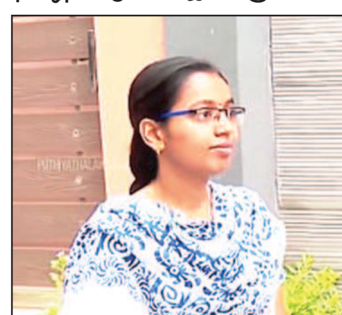
அன்று தமிழ்நாட்டு தலைவர் விஜய் சேதுபதி இன்று துணை ஆட்சியர்

சென்னை, ஜூன் 22 - நீங்கள் 'நான் முதல்வன்' திட்டத்தின் பெயரை மாற்றலாம். ஆனால் அத்திட்டத்தின் சாதனைகளையும் நன்றியுணர்வையும் மக்கள் மனங்களில் இருந்து நீக்க முடியாது. இத்திட்டத்தை முடக்குவது தமிழ்நாட்டு இளைஞர்களின்