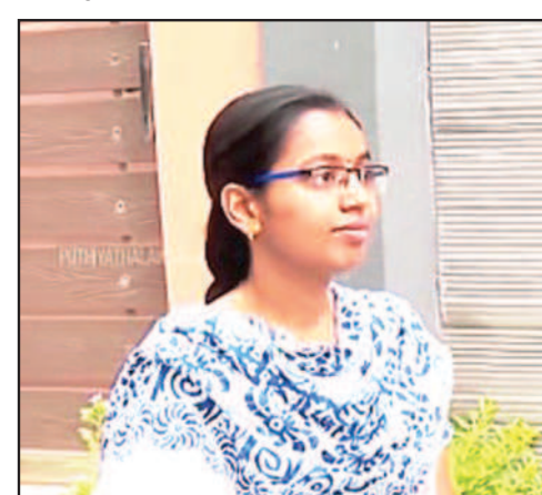
அன்று தமிழ்நாட்டு தலைவர் விஜய் சேதுபதி இன்று துணை ஆட்சியர்

சென்னை, ஜூன் 22 - நீங்கள் 'நான் முதல்வன்' திட்டத்தின் பெயரை மாற்றலாம். ஆனால் அத்திட்டத்தின் சாதனைகளையும் நன்றியுணர்வையும் மக்கள் மனங்களில் இருந்து நீக்க முடியாது. இத்திட்டத்தை முடக்குவது தமிழ்நாட்டு இளைஞர்களின்