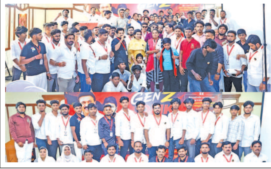
மின் கட்டணம் கணக்கீடு செய்வதில் தாமதம்:மின்கட்டணம் தாறுமாறாக எகிறியது!