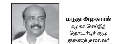
மருது அழகுராக் கழகச் செய்தித் தொடர்புக் குழு துணைத் தலைவர்