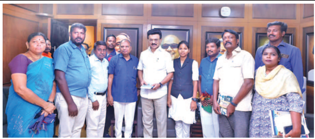
கழகத் தலைவர் மு.க.ஸ்டாலின் அவர்களை அண்ணா அறிவாலயத்தில் ஆதித் தமிழர் பேரவை நிறுவனத் தலைவர் இரா.அதியமான் தலைமையில் அக்கட்சியினர் சந்தித்துப் பேசினார்.