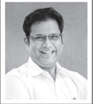
இதுகுறித்து அவரது அறிக்கை வருமாறு:-

சென்னை, ஜூன்.25- தமிழ்நாட்டின் முதலீடுகளைச் சீர்குலைக்கும் 'ரீல்ஸ் கோஷ்டி அரசு' இனியாவது ஆக்கப்பூர்வமான பணிகளில் கவனம் செலுத்த வேண்டும் என கழக தகவல் தொழில்நுட்ப அணிச் செயலாளரும், முன்னாள் அமைச்சருமான முனைவர் டி.ஆர்.பி. ராஜா அறிக்கையில் பதிலடி கொடுத்துள்ளார்.