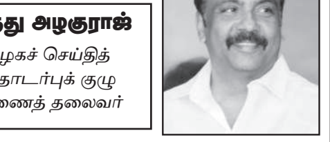
மருது அழகுராஜ் கழகச் செய்தித் தொடர்புக் குழு துணைத் தலைவர்

சைகை காட்டினார் பொத்தத்தில் குத்தாட்ட முதல்வரது கொள்கைப் பாடலால் சொன்னால் “கறைபடிந்த சிடி” அம்புட்டுத்தார்.