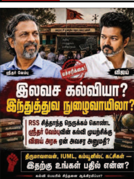
திருமாவளவர், IUML, கம்யூனிஸ்ட் கட்சிகள் - இதற்கு உங்கள் பதில் என்ன?

திரு.மு.க. அரசில் ஊழல் இருந்ததாகவும், அதை த.வெ.க. அரசு முற்றிலும் ஒழித்துவிட்டது என்ற பிம்பத் தோற்றத்தை உருவாக்கவே, இதுபோன்ற கட்டுக்கதைகளை அழித்துவருகிறார்கள்.