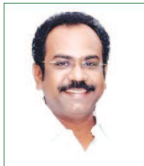
விளக்கம் அளிக்க வேண்டும் என்று குறிப்பிட்டுள்ளார்.

சென்னை, ஜூன்.27 - பள்ளி மாணவர்களுக்குச் சாதி அடையாளத்துடன் அடையாள அட்டை வழங்கப்படும் என்று அமைச்சர் ஒருவரால் அறிவிக்கப்பட்டதற்கு முன்னாள் அமைச்சர் தங்கம் தென்னரசு தமது சமூக வலைதளப் பக்கத்தில், இதன் காரணமாக மக்கள் மனதில் எழுந்துள்ள சந்தேகங்களுக்கு விளிவான